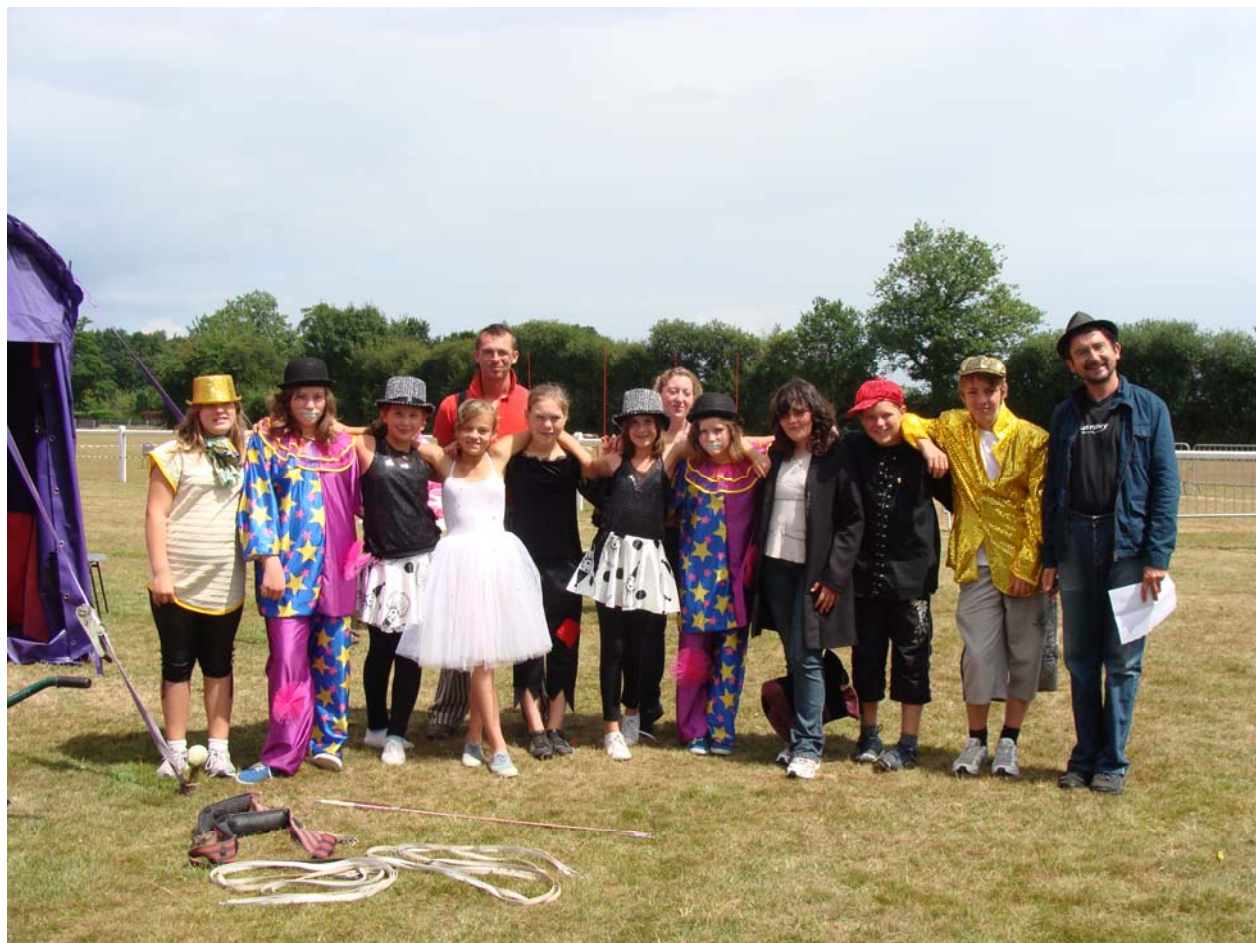
Ateliers du mercredi organisé par la Communauté d'Agglomération de ROUEN ELBEUF AUSTREBERTHE (C.R.E.A.) Septembre et Octobre 2010